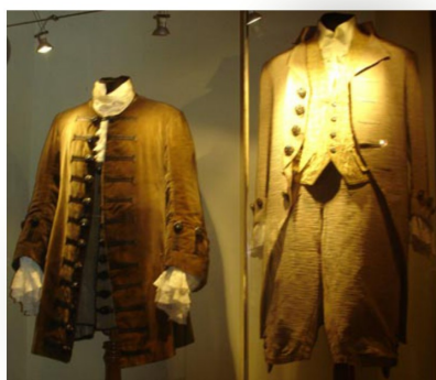
Costumi e trucchi di scena del grande Tenore Beniamino Gigli (Museo Gigli, Recanati)

Durante il Concerto finale a teatro gli Allievi useranno alcuni oggetti di scena appartenuti al grande Beniamino Gigli